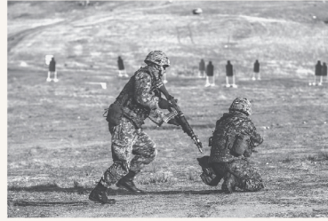
米海兵隊との共同演習で射撃訓練をする陸上自衛隊員