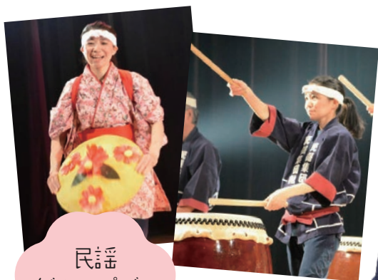
民謡 グループでの 活動